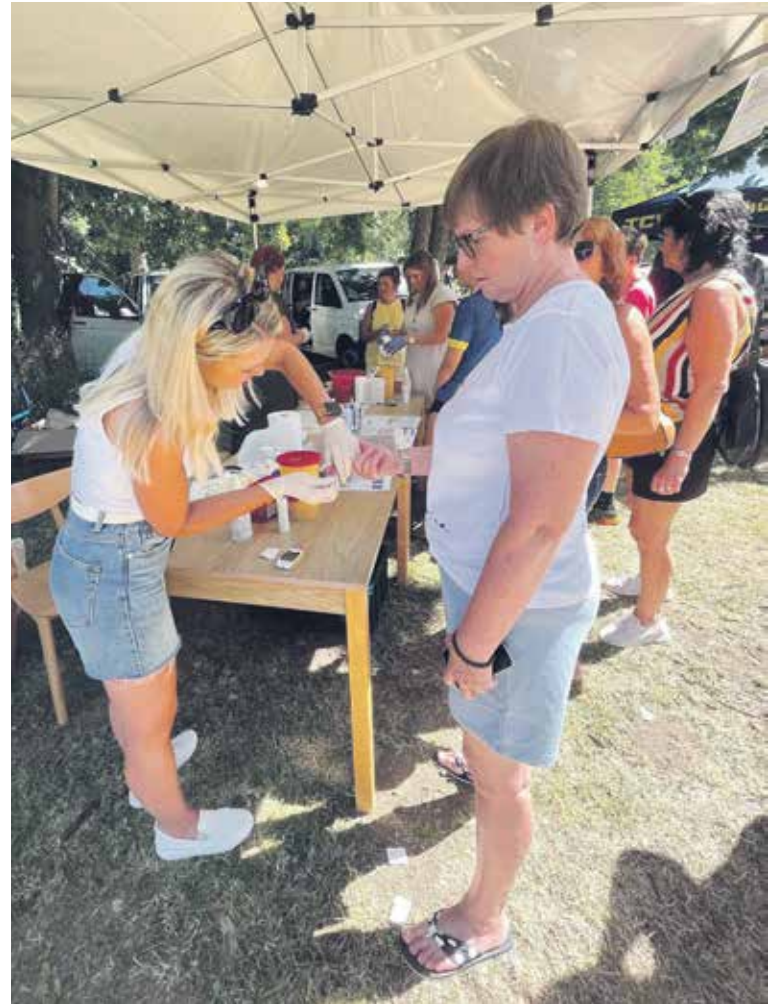
LIDÉ SI MOHLI VE STÁNKU nechat zjistit hladinu cukru v krvi nebo se dozvědět více o dárcovství krve.