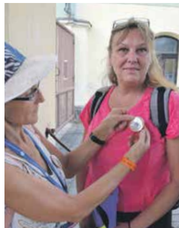
POSLEDNÍ připnutý odznáček festivalu.