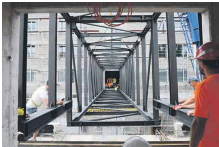
V ČERVNU DOŠLO K VYZVEDNUTÍ jedné části nadzemního koridoru od přístavby chirurgie. Nová „lávka“ z ocelových profilů je dlouhá 26 metrů a váží 17 tun.