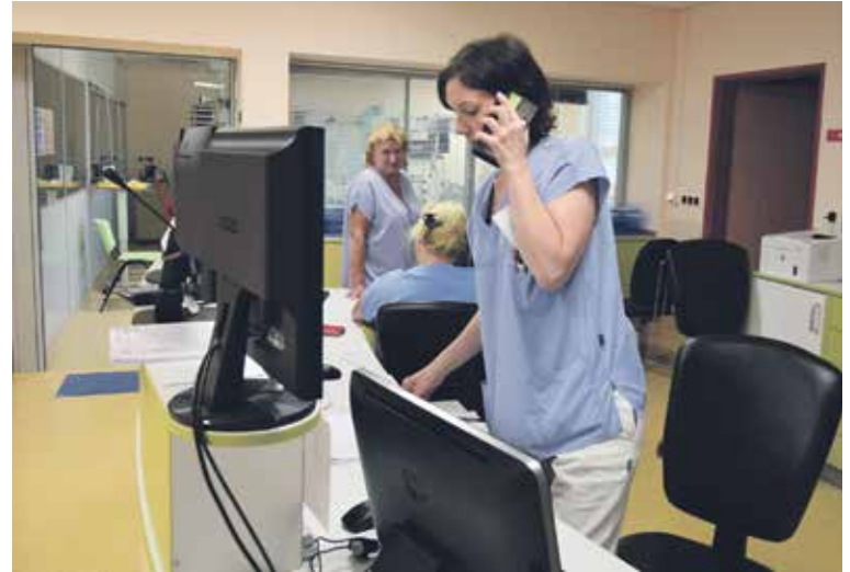
NA ODDĚLENÍ ARO leží pacienti v kritickém stavu se selháním životních funkcí.

Ambulantní část práce ARO se odehrává v ambulanci bolesti, anesteziologické ambulanci a nutriční ambulanci. (zik)