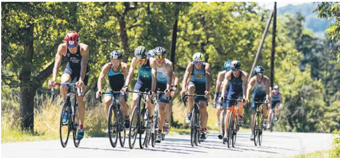
NA TRIATLONU SE KONALY CELKEM TŘI ZÁVODY. Sportovci museli zvládnout cyklistiku, plavání a běh.

Generálními partnery akce bylo město Benešov, Středočeský kraj a Česká triatlonová asociace. Dalšími hlavními partnery byly společnosti BTL Medical Technologies s. r. o., Pinko a. s. a Elmoz Czech s. r. o. (red)