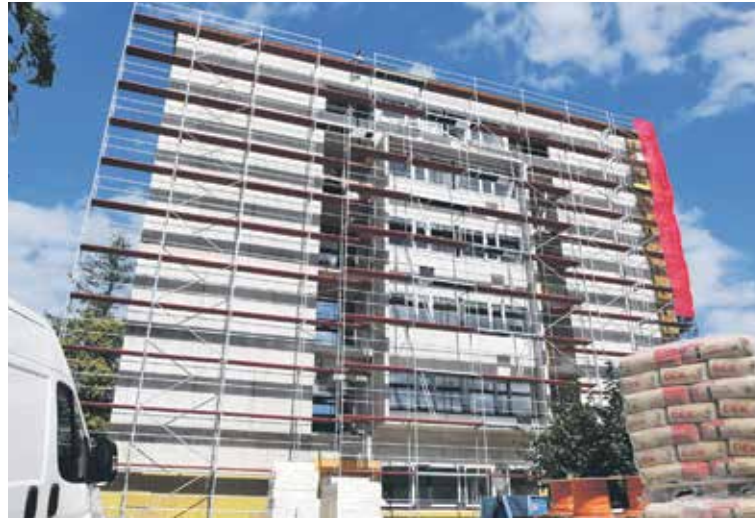
V PŘÍSTAVBĚ CHIRURGIE se v první fázi, tedy koncem letošního roku, otevře suterén, přízemí a první patro.

„Často slyšíme, že nový urgentní příjem bude dům duchů bez zaměstnanců. Vítám, že se konečně bez servítek a plošně mluví o tom, jak se dlouhé roky složitě zajišťují lékařské služby tak, aby se nemocnice mohly nonstop starat o pacienty, vychovávat lékaře a aby ideálně byly v co největší shodě se zákoníkem práce. Jako stárnoucí lékař naprosto chápu požadavky mladých lékařů. Když se ohlédnou čtvrt století nazpět, moc si nepamatuji na dětství synů, protože jsem je celé trávil službami na chirurgii, přivýdělkem na plastice a na záchrance. Dělal jsem to rád, protože pouze tím počínem