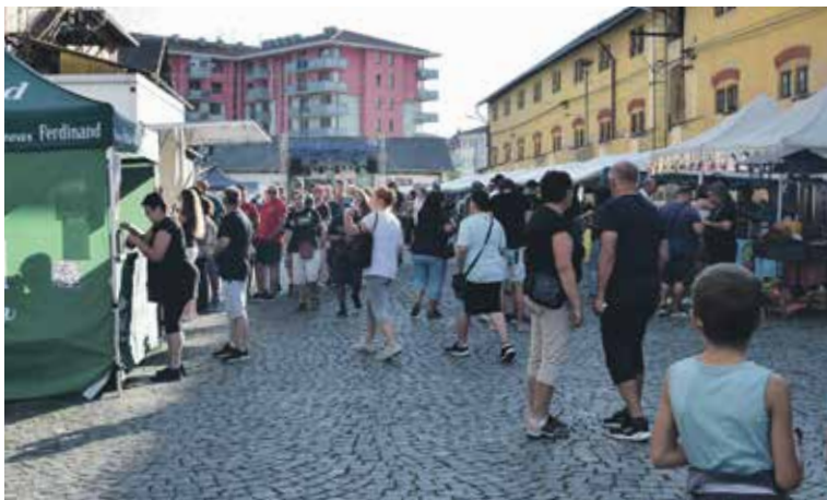
FESTIVAL navštívilo přes tisíc lidí.

Letošní festival byl realizován za podpory Nemocnice Rudolfa a Stefanie Benešov, hlavního partnera Pivovaru Ferdinand, BDS, Linet, Quo, Pro 21, Promedica, MGC, Laka CZ, Pinko a s., Střední zdravotnické školy Benešov a mediálního partnera Rádia Blaník. (red)