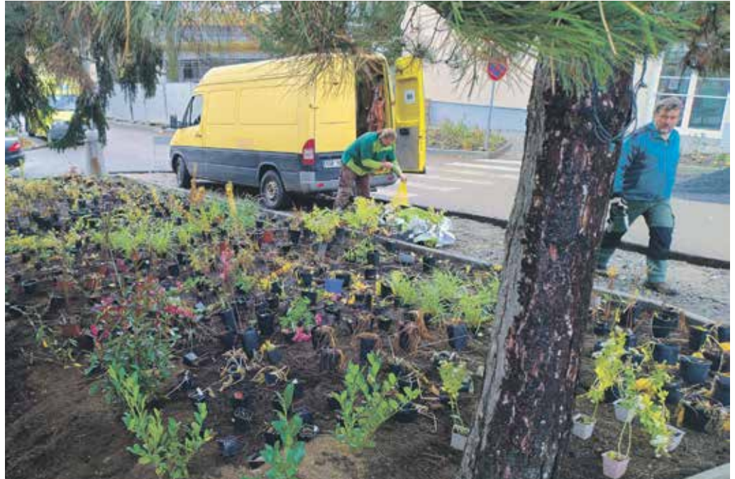
NA OSTRŮVKÁCH U NEMOCNIČNÍCH PAVILONŮ vznikají nové záhony, v minulosti například u onkologie, u budovy dlouhodobé ošetrovatelské péče či lékárny. Nyní byl osázen trvalkami prostor vedle pavilonu A, kde je pokladna či odběrové místo.

„Důkazem toho, že se snažíme o stromy pečovat, je, že jsme lípu před vstupem do nového centrálního vstupního pavilonu, která je nejstarším stromem