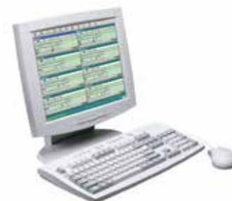
CENTRÁLNÍ MONITOROVACÍ SYSTÉM.