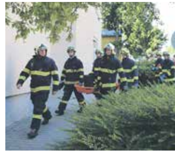
HASIČI SE ZÚČASTNILI v nemocnici již několika cvičení, například i společně s dalšími složkami IZS.