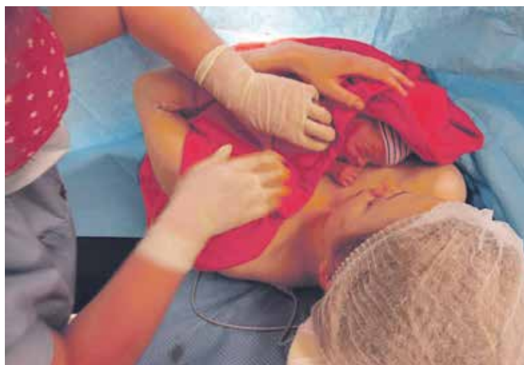
Při BONDINGU je miminko po porodu přiloženo na holý hrudník matky či otce, takzvaně skin to skin – kůže na kůži.

• Novorozenecké oddělení Nemocnice Rudolfa a Stefanie Benešov získá díky velkorysému daru ve výši 500 tisíc korun od společnosti Sellier & Bellot z Vlašimi nový monitorovací systém. Tento systém slouží ke sledování fyziologických funkcí novorozence a je velmi důležitý, především při monitorování miminka těsně po porodu ještě na porodním sále. Bude zakoupeno pět monitorů a dvě centrální stanice.