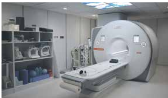
UMÍSTIT MAGNETICKOU REZONANCI na její místo trvalo odborníkům několik hodin. 3x foto: Markéta Zikmundová