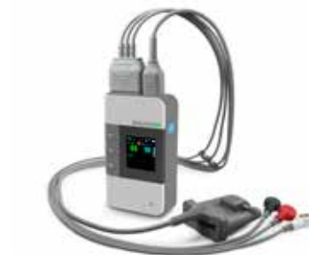
TELEMETRICKÝ SYSTÉM pro monitoraci EKG a SpO2.

Pozitivní ohlasy přišly například od Knihkupectví Daniela Benešov, Verold Benešov, BonaVita, C.I.D Praha, s.r.o., Wrigley Confections ČR, přispěli i zaměstnanci České spořitelny Benešov. „Chceme moc poděkovat za nečekané množství darů. Těto podpory si neskutěčně vážíme. Děkujeme jménem dětí a celého týmu pracovníků dětského