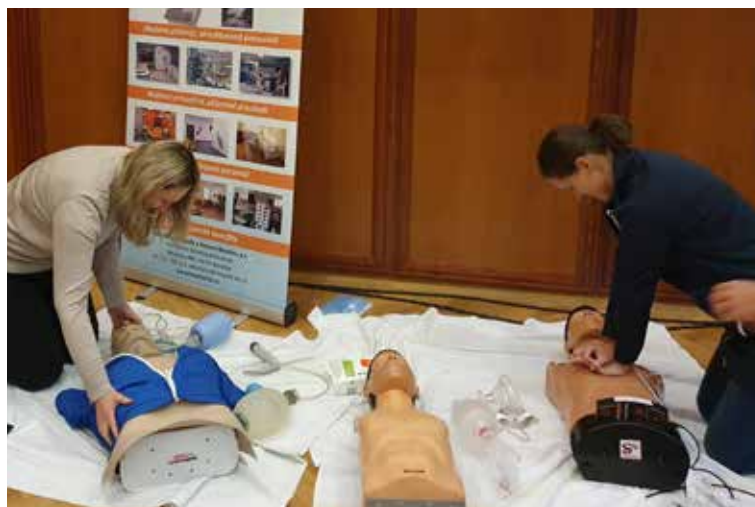
ÚČASTNÍCI KONFERENCE si mohli vyzkoušet resuscitaci pacienta i s použitím automatizovaného externího defibrilátoru – AED.

Zaměstnanci nemocnice jsou školeni periodicky a školení jsou povinná. Liší se podle odbornosti a pracovního zařazení. Jsou proškoleni všichni zaměstnanci nemocnice, včetně technicko hospodářských pracovníků tak, aby byli schopni zahájit resuscitaci. U většiny pacientů, pokud dojde k náhlé zástavě srdeční, se jedná o pacienty hospitalizované. Pro tyto případy jsou v nemocnici nastavené mechanismy a postupy tak, aby se co nejdříve dostalo pacientovi adekvátní resuscitační péče. V případě náhlé srdeční zástavy zahájí zaměstnanci dotčeného oddělení resuscitaci a následně aktivizují nemocniční resuscitační tým. Do jeho příchodu provádí resuscitaci zaměstnanci