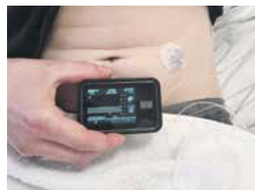
INZULINOVÁ PUMPA je přístroj, který pomocí kanyly zavedené do podkoží umožňuje podávání inzulínu bez vpichů.