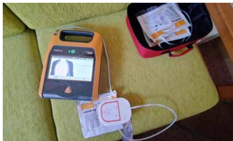
NAŠE NEMOCNICE nově zakoupila výcvikový AED, aby mohla provádět školení i s praktickým nácvikem.