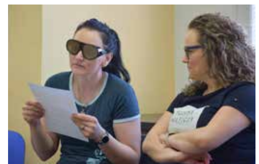
SE SPECIÁLNÍMI BRÝLEMI se snažily účastnice semináře přečíst formulář nebo jízdní řád.

Kurz měl velký úspěch, další se bude konat na podzim. (zik)