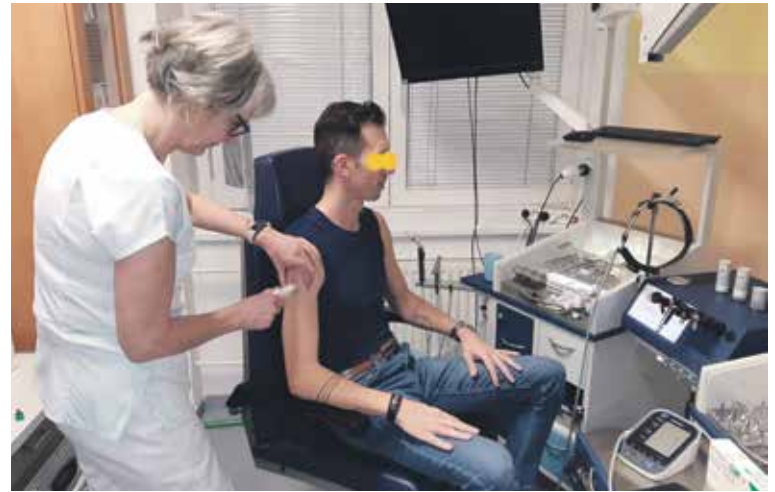
BIOLEČBA ZATÍM PROBÍHÁ u jednoho pacienta ORL oddělení. Na snímku zdravotní sestra pacientovi aplikuje bioléčbu.

Podle lékařky jsou pro výběr kandidátů do studie přísná kritéria, která pacient musí splnit, aby byl zařazen. „U nosní polypózy se hodnotí vzhled nosních polypů a určitý stupeň. Endoskopický záznam se zasílá zahraniční komisi ke zhodnocení, pacienti