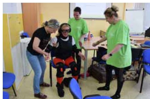
GERONTOOBLEK simuluje stáří pomocí speciálních vest a dlah.

ní. Chodit a vnímat okolí bylo podle nich velmi obtížné. „Vlastní zkušenost, jak se může cítit starý člověk, určitě zkvalitní práci každého profesionála.“