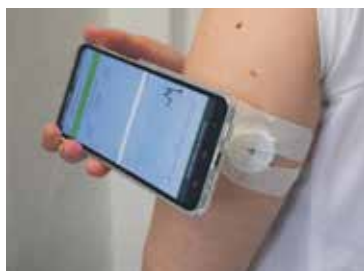
SENZOR NA MONITORACI GLYKÉMIE se umísťuje na paži, stačí mít mobil a aplikaci, a přiložením diabetik zjistí hladinu glukózy.

Diabetologie jde kupředu a máme k dispozici nyní zejména nové technologie, například senzory na monitoraci glykémie, které se umísťují na paži. Každý diabetik potřebuje vědět několikrát denně, jakou má hladinu glukózy. Běžně se používají glukometry, kdy se měří glykémie z kapky kapilární krve z prstu, a to je ale velký dyskomfort. Senzorů je mnoho druhů, my pracujeme s Dexcomem nebo FreeStyle Libre. Stačí mít mobil a aplikaci. Telefon diabetik přiloží k senzoru a okamžitě ví, jakou má glykémii. Pokud si nastaví alarmy, je ihned upozorněn, kdy glykémie příliš klesá či stoupá. U FreeStyle Libre II se informace přenáší pomocí Bluetooth systému „live“. Pacient tak může předejít akutnímu stavu. V inzulínových pumpách se též odehrál velký boom, nyní můžeme využívat třeba uzavřené okruhy, tato pumpa tak trochu přemýšlí za pacienta.