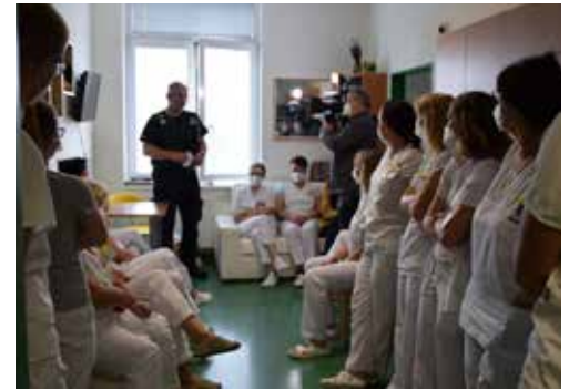
SPOLUPRÁCE S MĚSTSKOU POLICIÍ Benešov spočívá také v přípravě a vyškolení personálu ohledně jeho bezpečnosti.