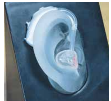
EXISTUJE NĚKOLIK DRUHŮ sluchadel, modely visící za uchem i nitroušní. Starším pacientům se zhoršenou jemnou motorikou se drobná sluchadla do ucha nedoporučují.