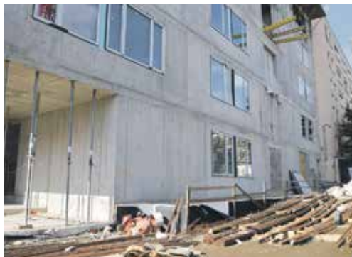
V PŘÍZEMÍ PŘÍSTAVBY vznikne jako první především Centrální příjem pro urgentní pacienty, kterých se ujme třídicí sestra.