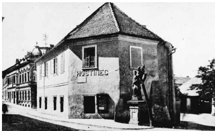
Z OBJEKTU PŮVODNÍHO STŘEDOVĚKÉHO ŠPÍTÁLU zůstal jen kostelík sv. Alžběty přestavěný na hostinec. I ten byl nakonec v roce 1965 zbořen.

V patře se nacházely byty pro jeptišky a malá kaple. Třetím objektem byl přízemní infekční pavilon, rozčleněný na dvě větší místnosti se čtyřmi lůžky, jedna pro pozorování pacientů, druhá s lůžky pro infekční nemoci, místnosti pro ošetřovatele, pro skladování prádla, lázně a toalety, dále umrlčí komora, kaple pro vypravování pohřbů, pitevna a místo pro dezinfekci šatů a prádla.