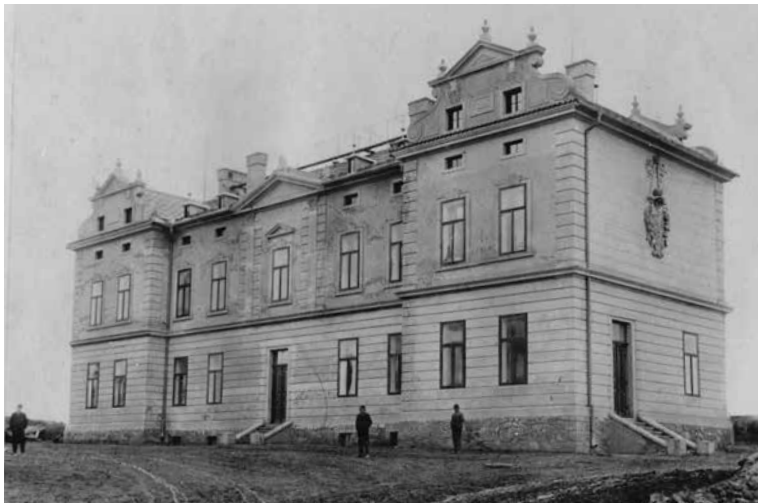
HOSPODÁŘSKÁ BUDOVA a kuchyně po výstavbě roku 1898.

• Nemocniční kuchyně existuje od vzniku nemocnice a zahájení jejího provozu v roce 1898.