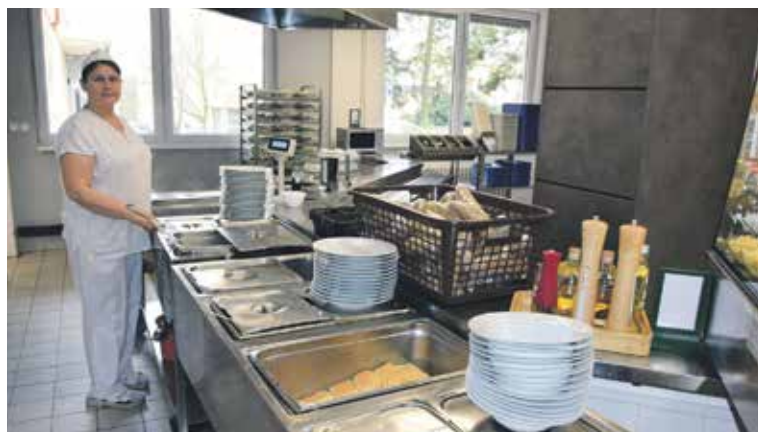
KUČAŘKY každý den vydávají obědy se čtyřmi druhy teplých jídel v jídelně, která nedávno prošla rekonstrukcí.