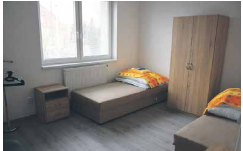
V DOMĚ JSOU JEDNOLŮŽKOVÉ a dvoulůžkové pokoje, jeho kapacita je maximálně devět osob.