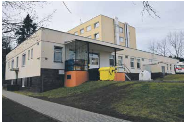
BUDOVA NOVÉ NEMOCNIČNÍ KUCHYNĚ byla postavena v roce 1996.

Každý den v kuchyni začíná před pátou hodinou ranní přípravou snídaní pro pacienty, následně vaření teplých pokrmů na aktuální den. Kolektiv tvoří