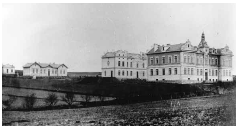
NEMOCNICE V DOBĚ SVÉHO VZNIKU 1898 – hlavní nemocniční budova, hospodářská budova, infekční pavilon a umrlčí komora.