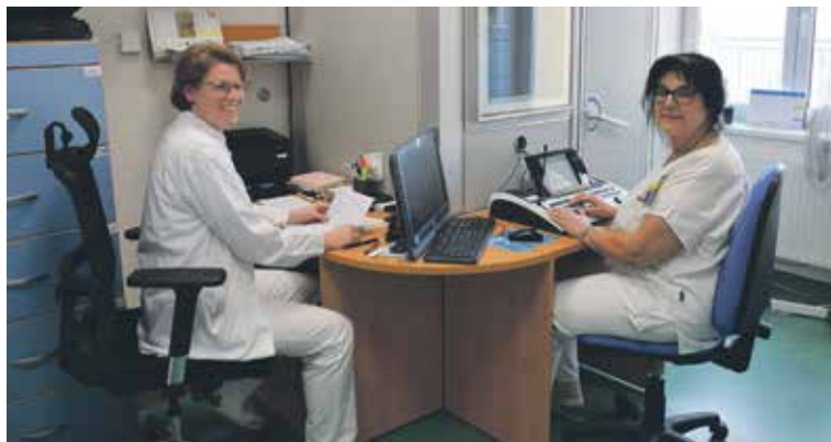
V AUDIOMETRICKÉ KABINĚ pacienta vyšetřují, jak z tónové (jak slyší), tak i slovní audiometrie (jak rozumí). Při ní se mu s přesnou hlasitostí přehrávají soubory testovacích slov, která opakuje.