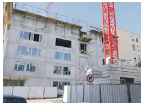
JELIKOŽ BYLA CELÁ STAVBA Centrálního příjmu a dostavby chirurgického pavilonu rozdělena do několika fází, první etapa rekonstrukce skončí již letos.