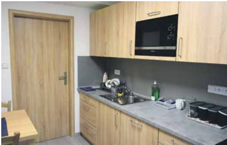
DŮM MÁ PŘÍZEMÍ A PATRO. Nájemníci mají v přízemí k dispozici kuchyň, společenskou místnost a v patře samozřejmě koupelnu.