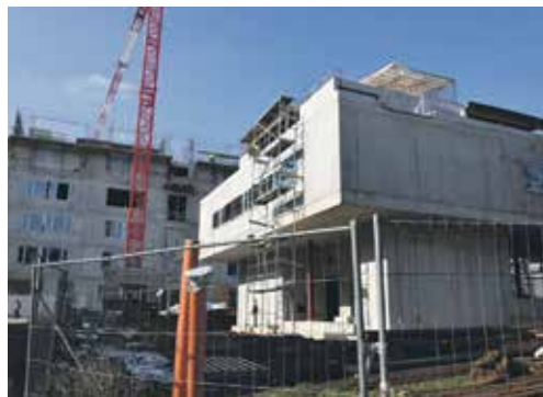
V PARKU VZNIKÁ KARTOTÉKA – recepce, kterou bude procházet nadzemní „krček“ spojující chirurgický a interní pavilon.