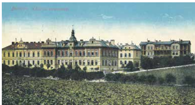
DALŠÍ ROZVOJ NEMOCNICE v jejich počátcích přinesl rok 1908, kdy byl otevřen nový chirurgický pavilon, úplně vlevo.