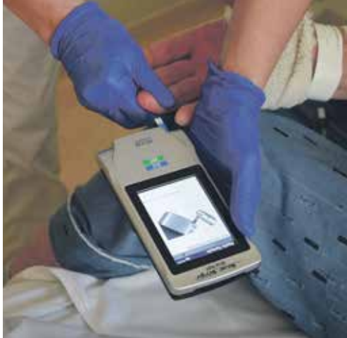
ZDRAVOTNÍ SESTRY s přístrojem na měření cukru v krvi obejdou i několik pacientů najednou. Výsledky se dozvědí do několika vteřin.

• Oddělení benešovské nemocnice jsou nově vybavena moderními glukometry pro testování přímo u lůžka. Ty ušetří především čas jak pacientům, tak lékařům. Množství cukru v krvi se totiž dozvědí do několika vteřin a mohou ihned indikovat případnou terapii.