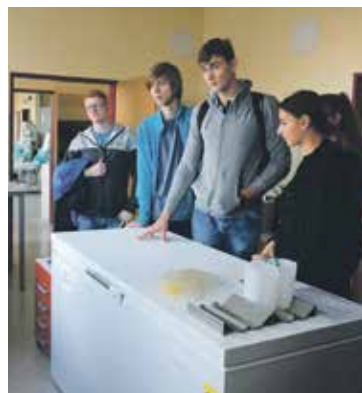
STUDENTI BENEŠOVSKÉHO GYMNÁZIA navštívili v listopadu naši transfuzní stanici, první desítka z nich se přihlásila na odběry krve.