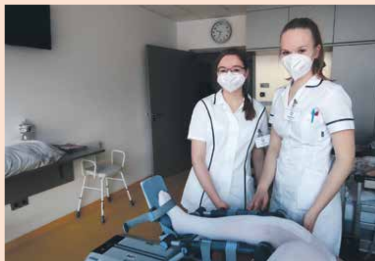
STUDENTI si prakticky vyzkoušeli práci i na ortopedickém oddělení.