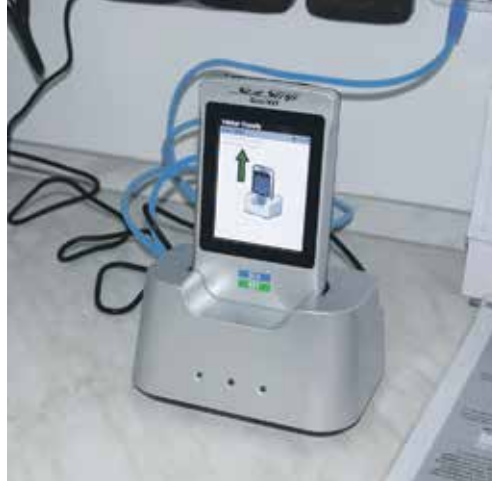
GLUKOMETR se vloží do dokovací stanice na oddělení a v tu chvíli se pošlou data přímo do počítače.

Přístroj měří glukózu, lidově cukr, z takzvané kapilární krve. To znamená, že se pacient pouze píchne do prstu a kapka krve s testovacím proužkem se vloží do přístroje. Ten okamžitě vyhodnotí stav. Používá se tedy u lidí, kteří nemají indikovaný velký krevní odběr spolu s dalšími vyšetřeními, jež se jinak provádí ze žíly.