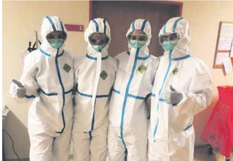
BUDOUcí SESTRÍČKY , studentky posledního ročníku benešovské zdravotní školy, pomáhaly na covidových odděleních.

V současné době Střední odborná škola a Střední zdravotnická škola nabízí čtyři studijní obory zakončené maturitní zkouškou – obor Praktická sestra, Asistent zubní technika, Sociální činnost a obor Veřejnosprávní činnost. S absolventy se setkáte na úřadech státní správy a samosprávy, na policii, na celnici a v advokátní kanceláři, pracují v domovech seniorů, v dětských domo-