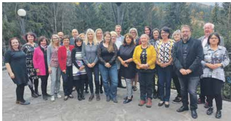
KONCEM ŘÍJNA se v Horní Lomné u Jablunkova nedaleko Třince konalo pracovní a vzdělávací setkání ombudsmanů a dalších pracovníků zabývajících se podněty a stížnostmi, které se týkají poskytování zdravotní péče.

„V drtivé většině případů fungujeme nejdříve jako hromosvody a pak mediátoři nějaké vyhocené situace nebo nedorozumění a snažíme se vše vysvětlit a najít nějaký kompromis. Dochází totiž často k jakémusi konfliktu očekávání pacienta a jeho příbuzných versus možnosti toho konkrétního zdravotnického zařízení a také někdy i možnosti lékařské vědy. Chyby se někdy bohužel stávají, zdravotníci jsou jenom lidé. Na nás ve zdravotnictví je takové oje-