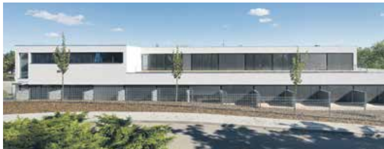
Budova rehabilitačního centra vypadá jako velká vila.

• Nový pavilon Komplexního rehabilitačního centra Nemocnice Rudolfa a Stefanie Benešov, a. s., Nemocnice Středočeského kraje se stal hlavním vítězem Stavby roku Středočeského kraje 2021. Zároveň byl i finalistou v soutěži Grand Prix Architektů.