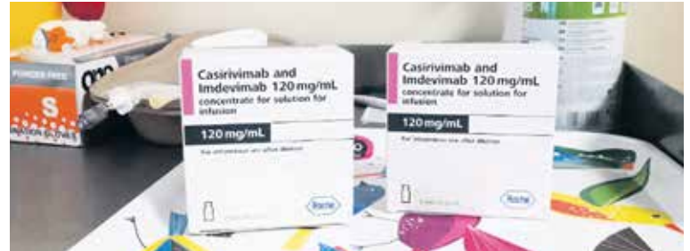
MONOKLONÁLNÍ PROTILÁTKY podáváme na základě indikace praktického lékaře či ambulantiho specialisty.

ti a respirátor FFP2 nebo FFP3, který musíte mít správně nasazený po celou dobu. Ihned po příchodu se nahláste na ambulanci č. 1 TRIAGE, personál vás odvede do izolační místnosti. V žádném případě si nesedejte do čekárny mezi ostatní pacienty.